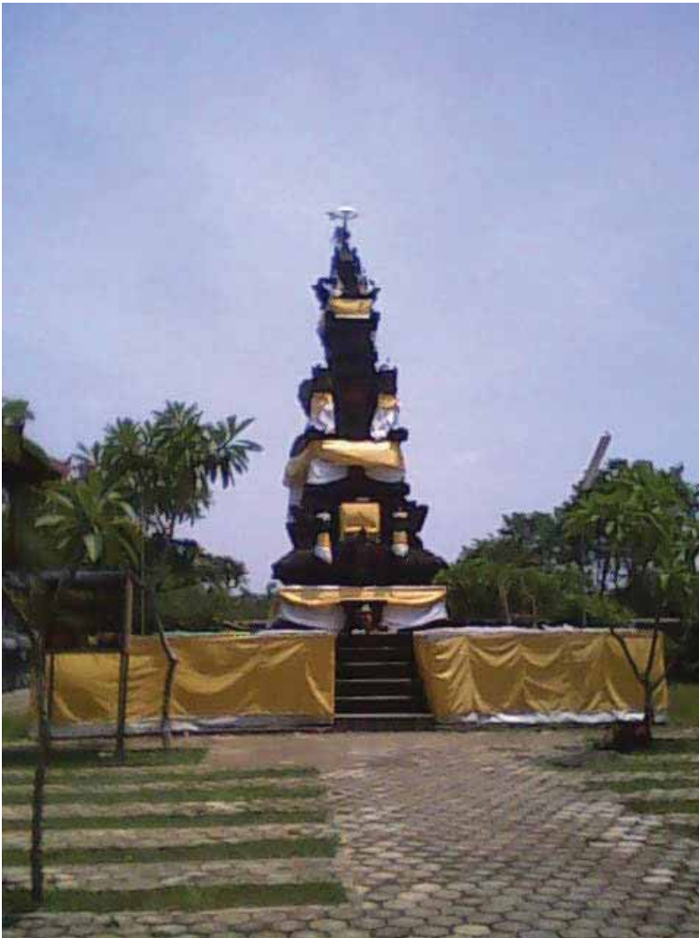
Pura Satya Loka Arcana