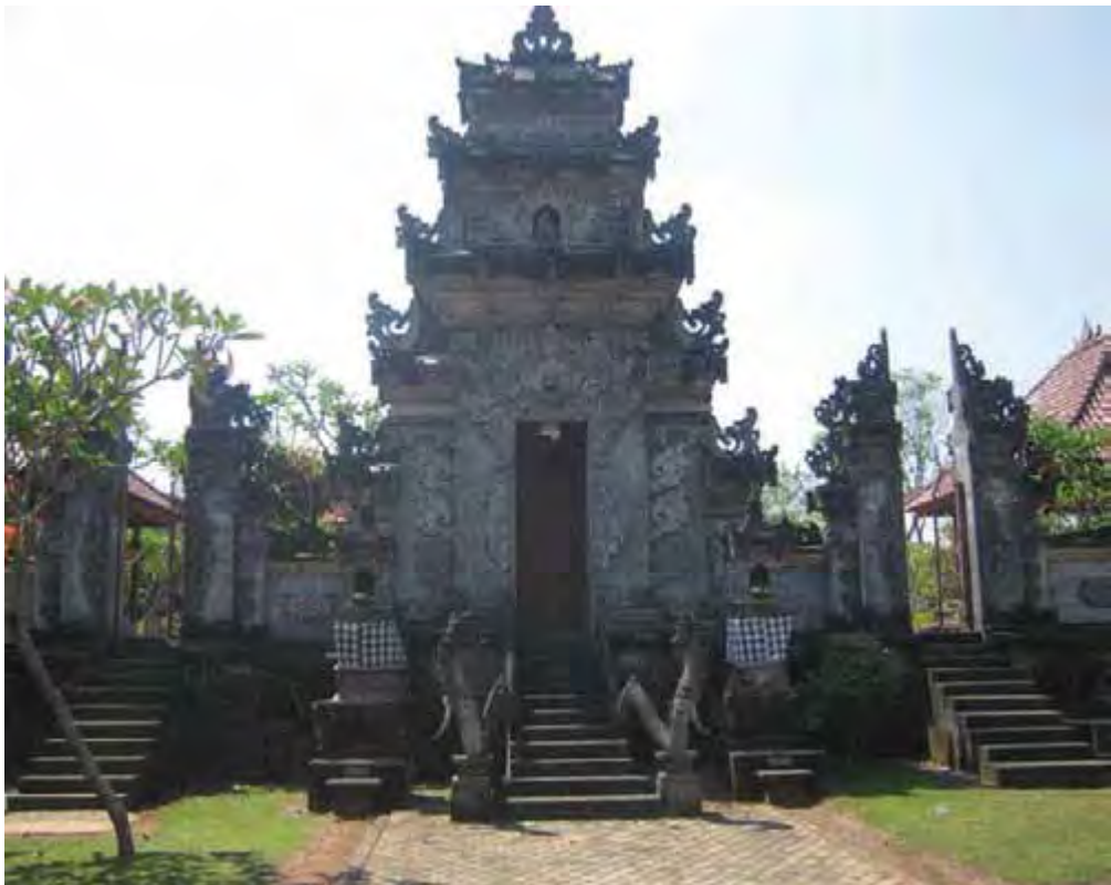
Pura Satya Loka Arcana, Ciangsana, Gunung Putri, Bogor