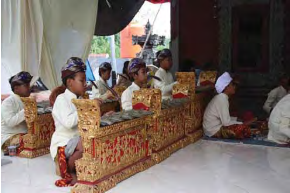
Pura Satya Loka Arcana, Ciangsana, Gunung Putri, Bogor