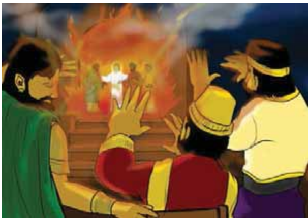
Gambar Malaikat, Sadrakh, Mesakh, dan Abednego

ke dalam perapian yang menyala-nyala." Sesaat kemudian musik pun mulai. Lalu semua orang berlutut di depan patung itu, kecuali tiga orang. Tiga orang berdiri, tinggi dan tegak. Hamba-hamba raja melihat ketiga orang itu berdiri. Mereka bertanya, "siapa ketiga orang itu? Alangkah berani mereka melanggar perintah raja." Mereka adalah ketiga sahabat Daniel, yakni Sadrakh, Mesakh, dan Abednego.