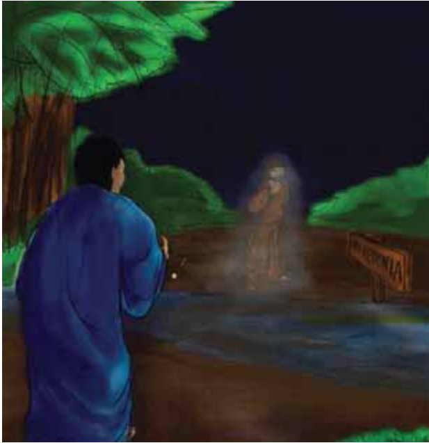
Gambar Roh Kudus mengarahkan Paulus ke Makedonia

Paulus dan Silas adalah pelayan-pelayan Tuhan yang memberitakan Kabar Baik tentang Yesus Kristus kepada banyak orang. Karena tugas itu, mereka pergi dari satu tempat ke tempat yang lain; mereka mengunjungi desa dan juga kota dan di sana mereka memberitakan Injil. Pelayanan dan pengajaran mereka itu membuat iman jemaat bertumbuh kuat. Itulah tugas yang mereka lakukan: memberitakan Injil, melayani, dan mengajar jemaat Kristen.