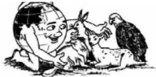
12. menjaga kelestarian binatang yang sudah hampir punah

Dua belas hal di atas hanyalah sebagian contoh kecil yang menggambarkan bagaimana caranya kita mencintai alam ciptaan Tuhan. Tahukah kalian, ketika Tuhan menciptakan alam semesta, maka yang dimaksudkan dengan alam semesta adalah segala sesuatu yang ada di bumi ini? Baik yang di darat, air maupun yang di udara. Dengan demikian, mencintai lingkungan hidup berarti kita juga mencintai alam semesta ini. Mencintai lingkungan hidup dapat dilakukan dengan selalu mau menjaga alam semesta ciptaan Tuhan.