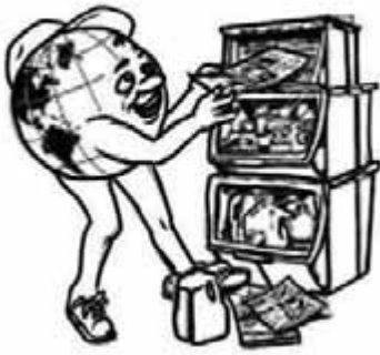
7. menempatkan barang pada tempatnya