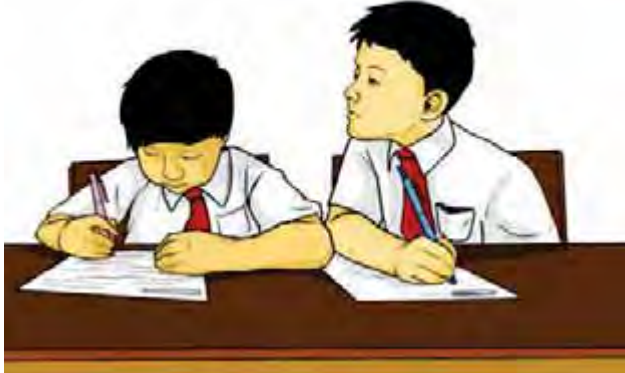
Gambar siswa di kelas yang sedang mencontek

adalah untuk menguji kemampuan dirinya, karena itu ia harus mengerjakannya seorang diri.