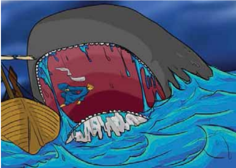
Gambar ikan besar menelan Yunus

Orang-orang itu bertanya, “apa yang dapat kami lakukan untuk menghentikan badai itu?” Jawab Yunus, “lemparkanlah aku dari kapal ini ke dalam laut yang dilanda badai itu. Lalu badai akan surut.” Orang-orang itu tidak mau melakukannya. Mereka terus-menerus berusaha mendayung kapal