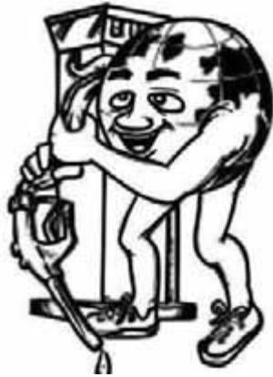
8. berhemat dalam menggunakan bahan bakar kendaraan