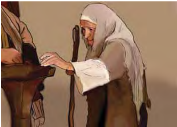
Gambar Perempuan Tua yang memberikan persembahan (Lihat Lukas 21:1-4)

Dari kisah di Lukas 2:1-4 kamu dapat melihat bagaimana seorang perempuan miskin memberikan persembahan dengan rela hati. Dan ternyata menurut Yesus persembahan perempuan itu justru bernilai tinggi, meskipun jumlahnya sedikit. Nilai artinya kualitas, sementara jumlah artinya kuantitas. Allah tidak melihat jumlah, tetapi kualitas si pemberi.