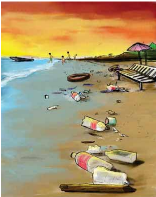
Gambar Tepi Pantai/Danau yang Kotor

anggukkan kepalanya tanda mengerti. Ia pun kemudian berkata, "kalau begitu, mulai saat ini, saya akan selalu memperhatikan alam yang indah sehingga tidak lagi dirusak oleh siapapun juga. Mulai dari sekarang saya akan selalu mencintai alam."