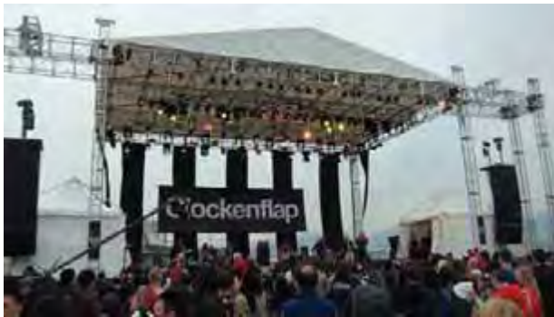
Picture 10.1

Note: WAS and WERE are used to express events that happened in the past i.e. those with nouns/adjectives/adverbs.