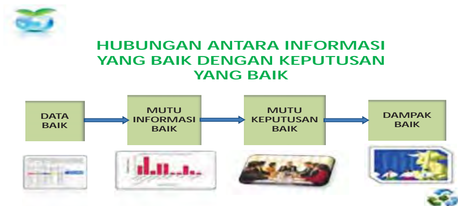
Gambar 5.1 Hubungan antara informasi yang baik dengan keputusan yang baik.

Fungsi informasi adalah sebagai dasar untuk pengambilan keputusan. Hubungan antara informasi dan pengambilan keputusan dapat dilihat pada bagan berikut.